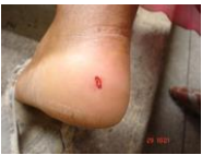
Fig 1: Paciente que foi espoliada por um morcego atendida no Hospital Municipal Tide Setubal

A análise dos dados se deu pelo banco de dados da Vigilância Epidemiologica do Município de São Paulo (Sinan Net), onde foi extraído a quantidade de atendimentos do agravo no Hospital e a espécie envolvida na notificação ( Caninos, Felinos, Primatas, Morcegos, Raposa e Outros ) , no período de Agosto de 2022 e Agosto de 2023 .